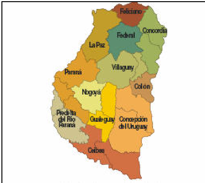
Figura 3. Zonas agroeconómicas de la provincia de Entre Ríos (RIAN, 2006; Engler et al., 2008). Las cuatro zonas analizadas en este proyecto son: la ZAH Paraná (que incluye los departamentos de Paraná - no relevado- y partes de Diamante y Victoria); la ZAH Nogoyá (Departamento Nogoyá); la ZAH Gualeguay (Departamento Tala y parte del Departamento Gualeguay) y la ZAH Concepción del Uruguay (que incluye los departamentos Gualeguaychú y Uruguay).