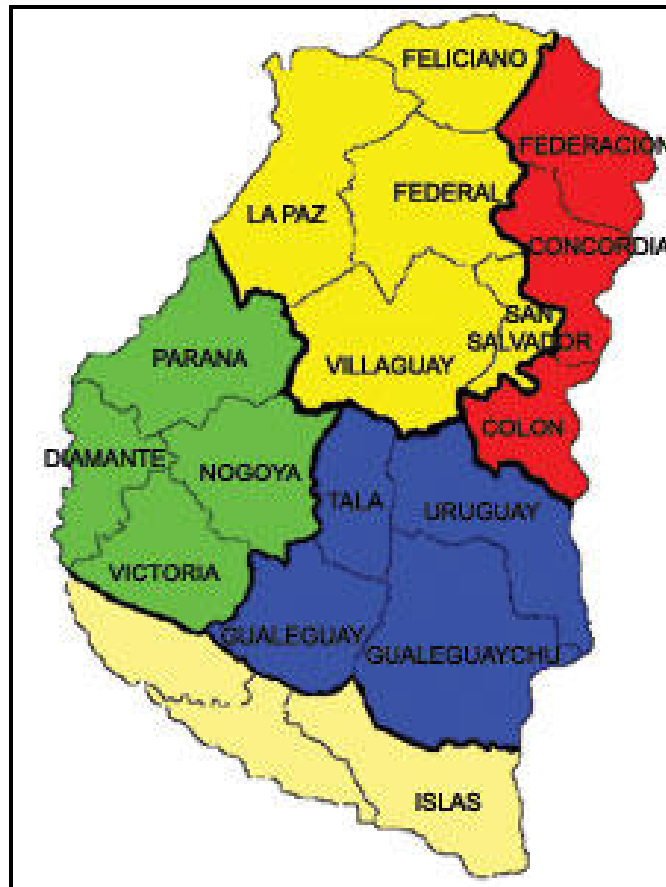
Figura 2. Zonas agroecológicas homogéneas (ZAH) de Entre Ríos (INTA, RIAP, 2006). En verde y en azul se detallan los departamentos incluidos en la Pampa Entrerriana. En verde: ZAH I (Incluye al Departamento Paraná – no relevado en este trabajo-; Nogoyá y parte de los departamentos Diamante y Victoria) y en azul: ZAH IV (incluye los departamentos Gualaguaychú; Tala y Uruguay y parte del departamento Gualaguay).

En cuanto a sus características generales puede decirse que dichas zonas se hallan dominadas por pastizales dedicados a la ganadería (predominantemente naturales o seminaturales) y por campos de cultivo (principalmente de soja, trigo y maíz). Como ambientes acompañantes pueden identificarse, fundamentalmente parches (con disposición básicamente lineal debido a su carácter remanente de la intervención humana) de montes naturales de espinillo ( Acacia caven ) con chilcas ( Baccharis spp.) y otros arbustos y árboles exóticos, cardos ( Eryngium sp.) y varios pastos de los géneros Stipa y Poa .