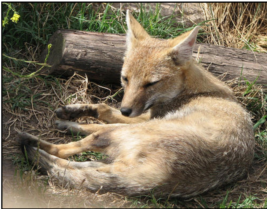
Figura 1. El zorro gris pampeano ( Pseudalopex gymnocercus )

Dichas transformaciones están provocando profundos cambios en el hábitat de muchas especies animales y, en algunos casos, favorecen una mayor acción “directa” (presión de caza) sobre las mismas por parte de las comunidades humanas. Esta situación puede provocar, en consecuencia, importantes variaciones en la abundancia y distribución de especies tales como el zorro gris pampeano ( Pseudalopex gymnocercus ), típico habitante de nuestras pampas, que junto con otros mamíferos medianos, fue y es sometido a una intensa presión de caza por ser considerado “plaga” para las actividades agropecuarias o bien por ser un tradicional e importante recurso (de subsistencia y/o comercial) para las comunidades humanas locales (Bucher, 2002; Bolkovic y Ramadori, 2006).