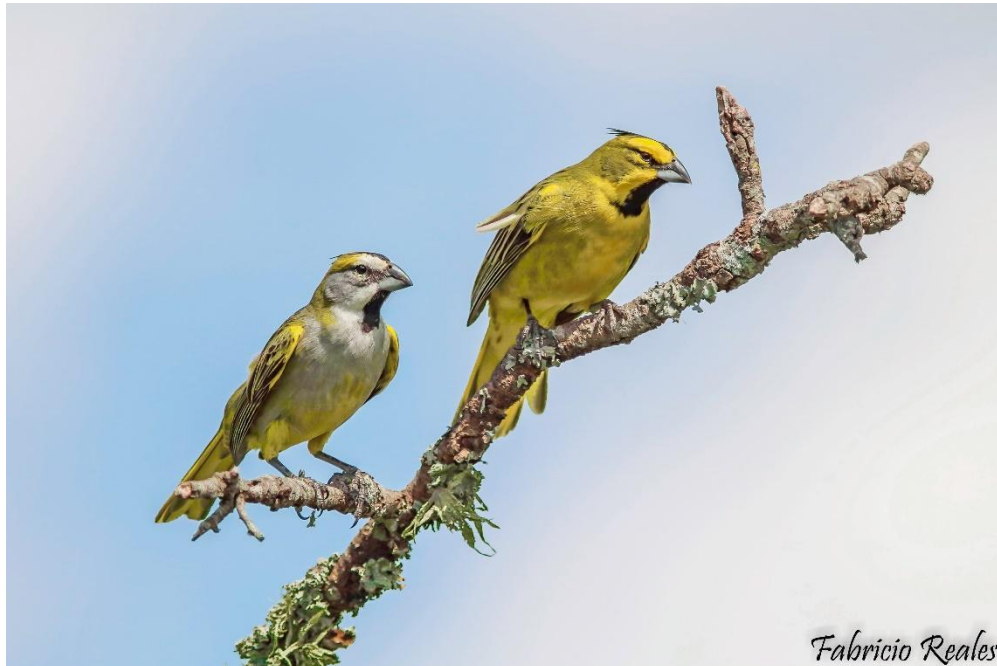
Monumento Natural Cardenal Amarillo ( Gubernatrix cristata )