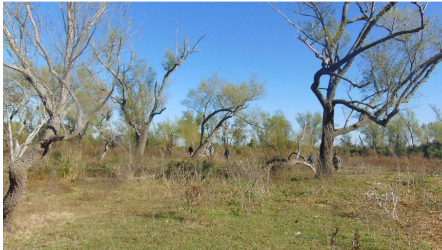
Parque Natural Monte de La Paloma, Aldea Brasileira, Diamante - Entre Ríos.

En el Parque Natural se reglamentará el funcionamiento a través de un ordenamiento del territorio que defina a la mayor parte de su superficie como área de protección y preservación estricta, y pequeños sectores afectados a un uso conservacionista, de recreación limitada y estrictamente regulada, con absoluta prohibición en cuanto al uso productivo extractivo de sus ambientes naturales.