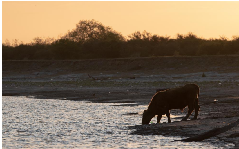
Reserva de Usos Múltiples “Santa Adelina”, Gualeguay, Entre Ríos.

Se reglamentarán a este fin, las normas de producción, de urbanización, de flujo poblacional, de fuentes de energías alternativas y otros aspectos pertinentes, de modo tal que, protegiendo los procesos naturales, se alcancen niveles de rendimiento de los recursos compatibles con su sobrevivencia y utilidad a perpetuidad.