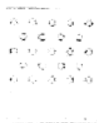
Figura 3: Baldosa de prevención