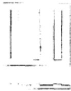
Figura 2: Baldosa guía